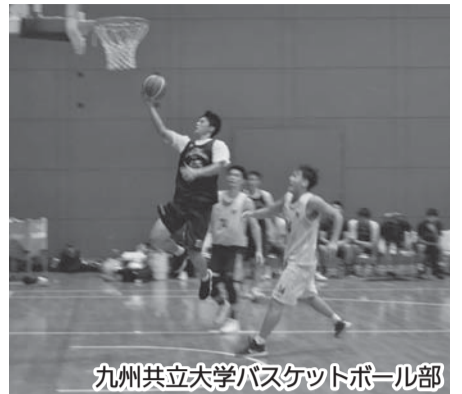
九州共立大学バスケットボール部