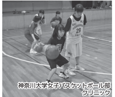
神奈川大学女子バスケットボール部 クリニック