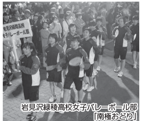
岩見沢緑陵高校女子バレーボール部 「南極おどり」