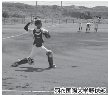
羽衣国際大学野球部

9月にはバレーボールVリーグのトヨタ車体クインシーズや、道内の大学バスケットボール部・バレーボール部、年明けには道内の高校野球部や大学卓球部、道外の大学バスケットボール部が来稚する予定となっています。