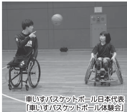
車いすバスケットボール日本代表 「車いすバスケットボール体験会」