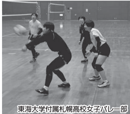
東海大学附属札幌高校女子バレー部