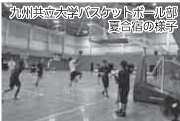
九州共立大学バスケットボール部 夏合宿の様子

この3月に、大学バスケットボール界の最高峰リーグといわれる関東大学バスケットボールリーグ1部に所属する神奈川大学男子バスケットボール部をはじめ道内外のチームが、稚内での合宿を予定しております。