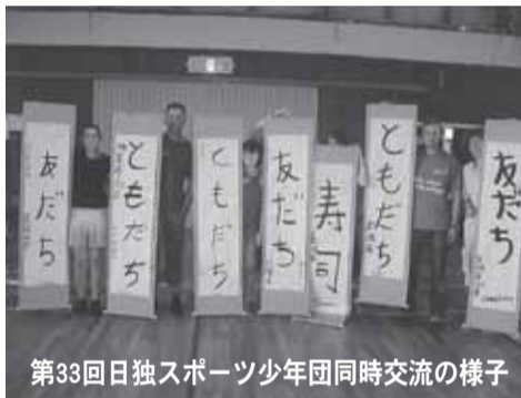
第33回日独スポーツ少年団同時交流の様子

私たちにできるフェアプレイ「スポーツでも、日常生活でも」を交流テーマに文化交流や宿泊交流などを通して、文化の違いや生活習慣の違いを感じながら両国の団員たちにとって貴重な国際交流となることを期待しています。