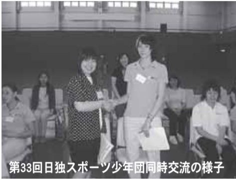
第33回日独スポーツ少年団同時交流の様子

北海道ブロックの稚内市を訪れるドイツスポーツユースの団員は、ドイツのベルリン・ブランデンブルグ州の指導者1名、団員6名の7名の交流団と通訳1名が、8月1日(金)〜6日(水)の6日間、わたり国際親善交流を深めます。