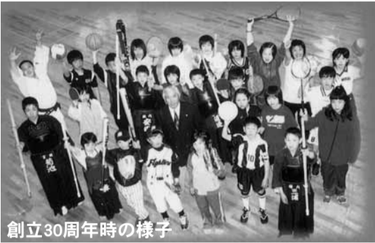
創立30周年時の様子

稚内市スポーツ少年団のほかに、40周年特別表彰として、結成後40年以上の単位スポーツ少年団や指導25年以上の登録指導者などの表彰を計画しております。