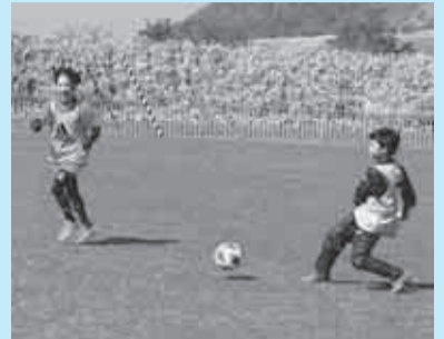
練習の様子 (CRECER稚内スポーツ少年団)

スポーツ少年団に入りたい！スポーツ少年団活動に興味がある！一度見学してみたい！どのような内容でも構いませんので稚内市スポーツ少年団事務局（☎28-1111）までお気軽にお問合せください。