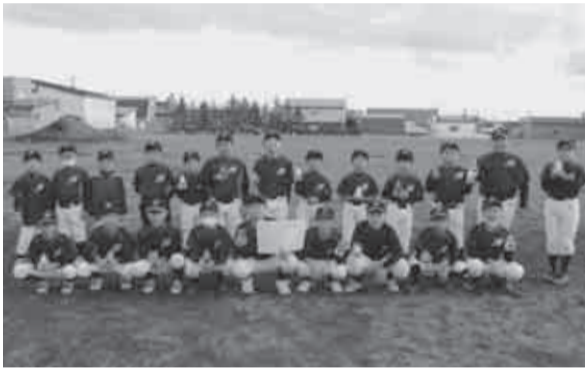
稚内ファイターズ野球スポーツ少年団