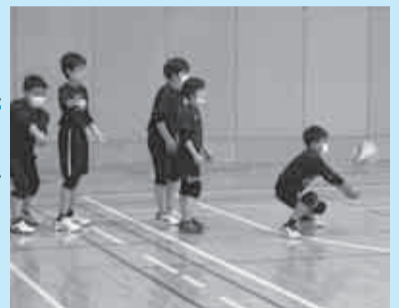
練習の様子 (稚内スワローズバレーボールスポーツ少年団)