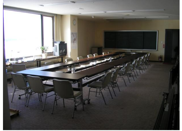
▼ミーティング室(30人収容)

●配置設備 スクリーン・ホワイトボード・DVDプレイヤー プロジェクター・ビデオデッキ・テレビ